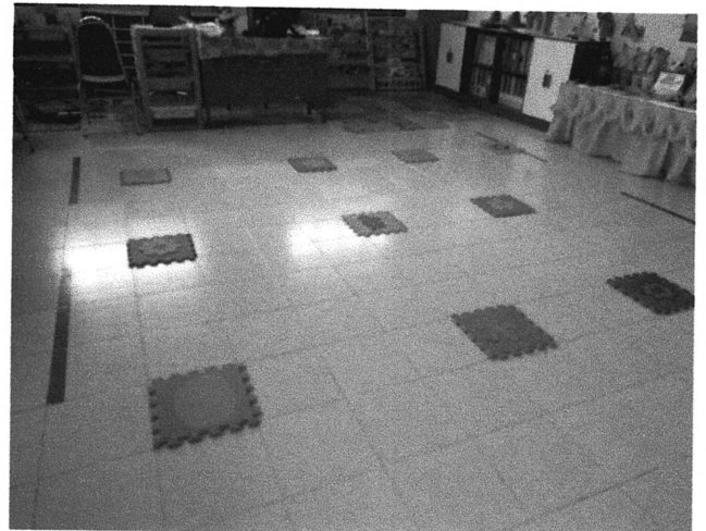
เว้นระยะห่างสำหรับที่นั่ง และทำกิจกรรมการเรียนรู้การสอนอายุ ๓ - ๔ ปี